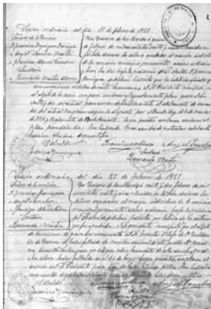
Acta de Sesión, 1925.

Una información más completa de los registros, así como las posibles lagunas cronológicas en la documentación, puede ser consultada en el inventario que dispone el municipio o en la base de datos accesible vía web, a través de la página: www.archivosmunicipalescaceres.es:81