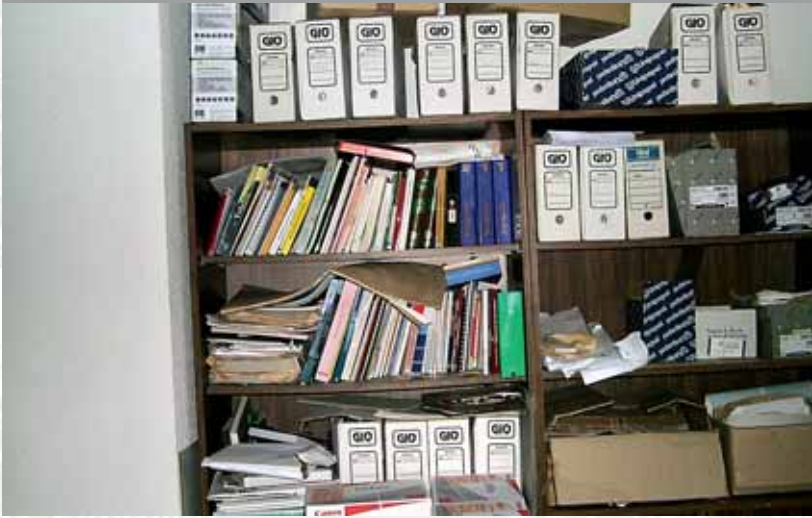
Archivo Municipal de Casares de Las Hurdes antes de elaborar el Inventario.