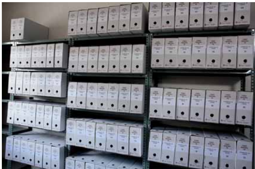
Archivo Municipal de Casares de Las Hurdes después de la elaboración del Inventario.