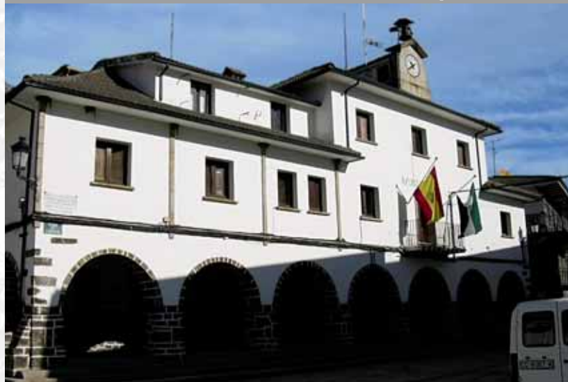
Ayuntamiento de Casares de Las Hurdes.