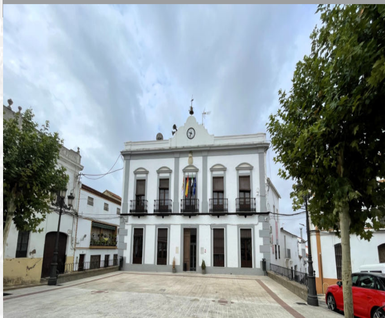
Ayuntamiento de Fuentes de León