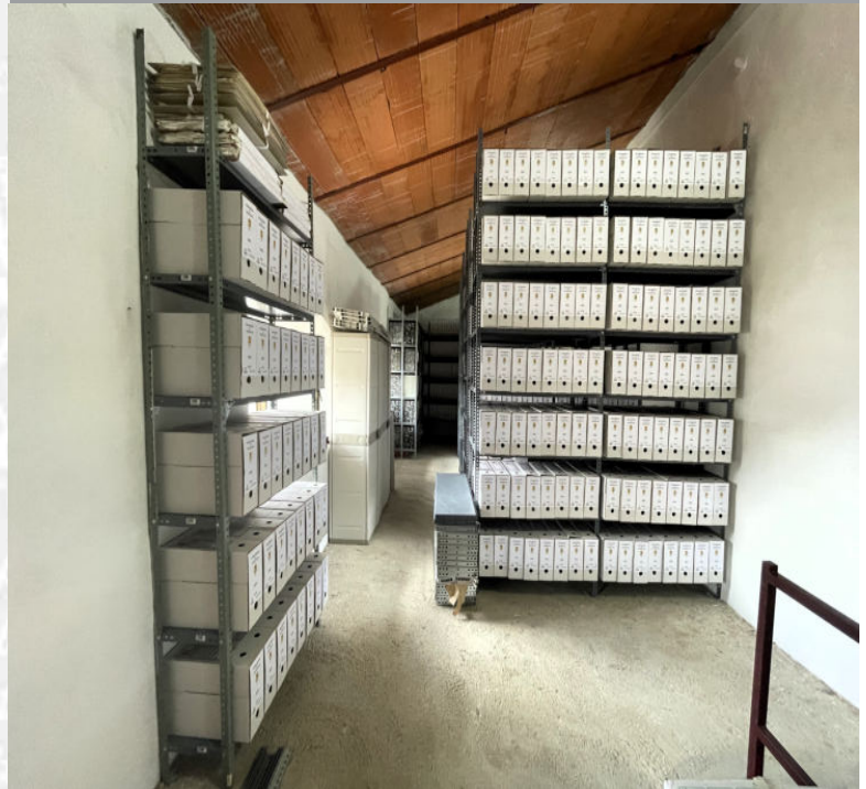
Archivo Municipal de Fuentes de León después de la elaboración del Inventario.

STREMADURA Por Lopez año de 1700. Fuera, por el ucia, y por el Occidente incia del Reyno de Port rte a sus 52. leguas, y Dezta por lo mas ancho tertilidad esta Pro- Rios Tago, y Guadiana, eviesan por enmedio, y elicos, que son el dion y el Ardilla & Badajoz la, Capital de la Provin- Obispado, y en Puente sobre diana, edificada por los Alcaza de Guerra y tiene Castillos, el uno del riginal, y del otro lado erro esta el fuerte de S. Merida lauerita Augu- nto tiempo lioeza de la antigua situa la sobre el Rio Guadiana.