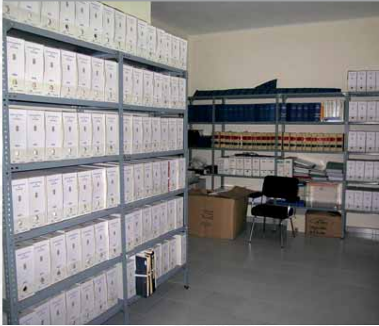
Archivo Municipal de Mengabril después de elaborar el Inventario.