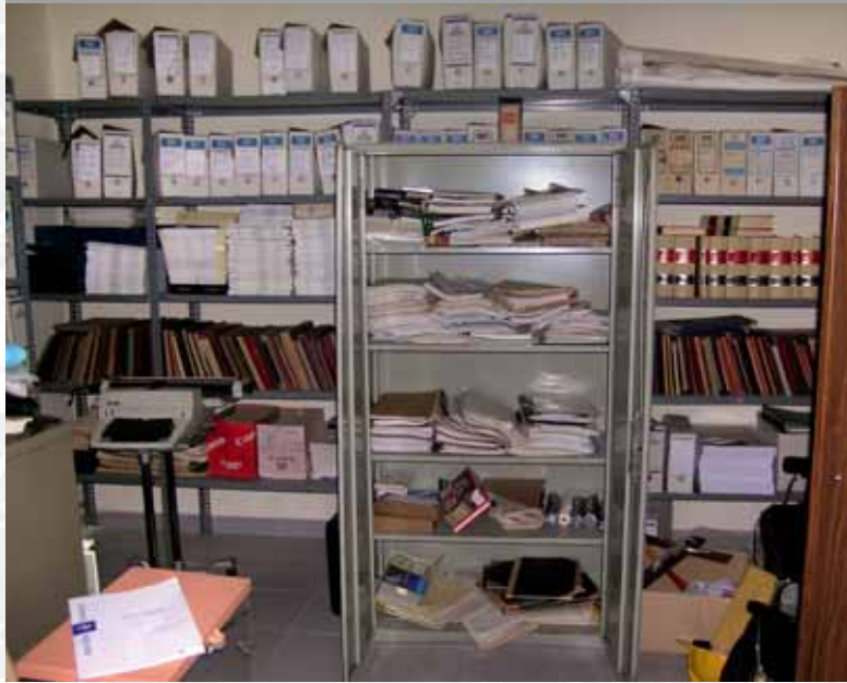
Archivo Municipal de Mengabril antes de elaborar el Inventario.