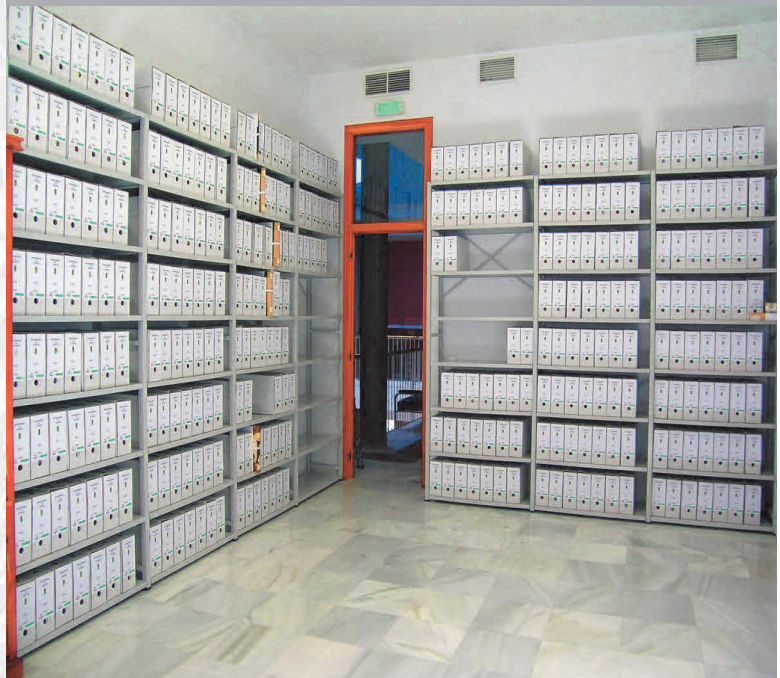
Archivo Municipal de Alconchel después de la elaboración del Inventario.