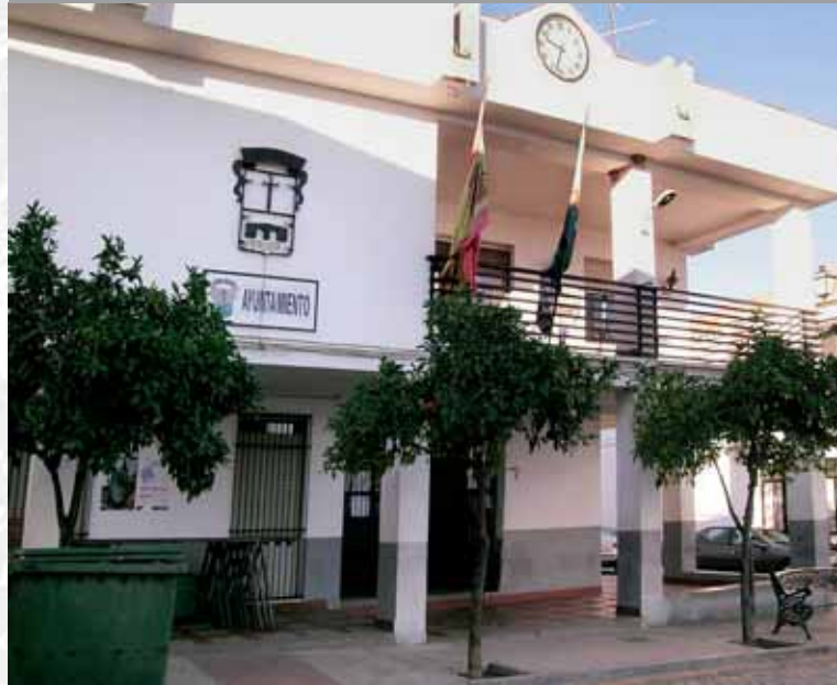
Fachada del Ayuntamiento.