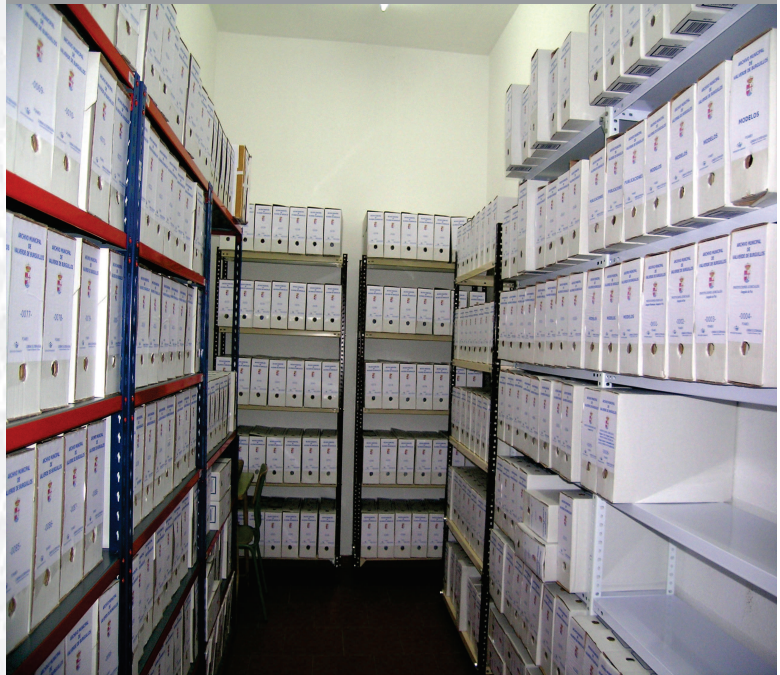
Archivo Municipal de Valverde de Burguillos después de la elaboración del inventario.