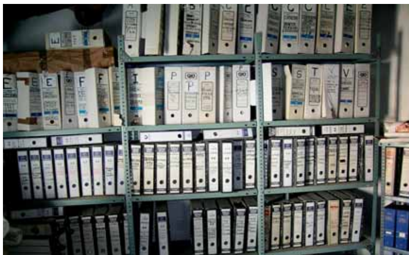
Archivo Municipal de Villarta de los Montes antes de elaborar el Inventario.