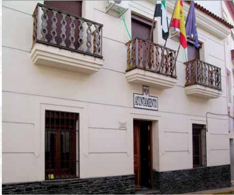
Fachada del Ayuntamiento.