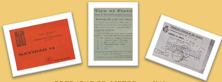
PREPARADOS, LISTOS, ... ¡YA! Tiro al plato: el deporte de puntería

Bajo el título “Preparados, listos, ... ¡YA!”, continuamos nuestro recorrido por los espectáculos de ocio y cultura. En esta ocasión hablaremos sobre espectáculos deportivos.