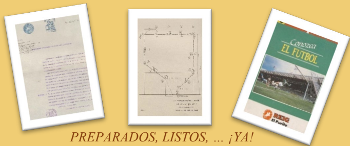
PREPARADOS, LISTOS, ... ¡YA! Fútbol, el deporte rey.

Bajo el título “Preparados, listos, ... ¡YA!”, continuamos nuestro recorrido por los espectáculos de ocio y cultura. En esta ocasión hablaremos sobre espectáculos deportivos.