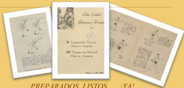
PREPARADOS, LISTOS, ... ¡YA! Atletismo: el deporte olímpico por excelencia.

Bajo el título “Preparados, listos, ... ¡YA!”, continuamos nuestro recorrido por los espectáculos de ocio y cultura. En esta ocasión hablaremos sobre espectáculos deportivos.