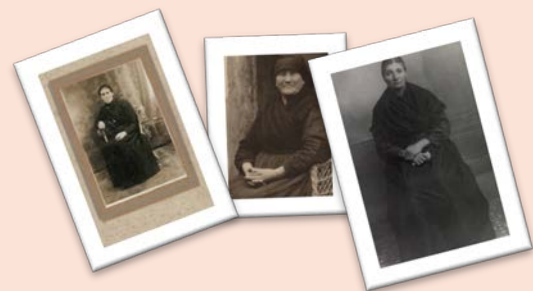
La edad dorada es la etapa de la vida que da comienzo a la vejez