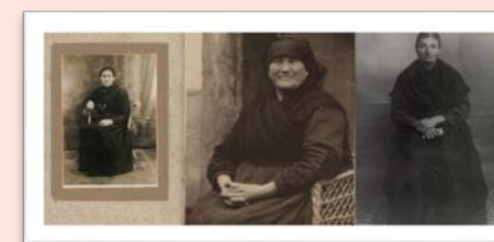
ES.10037.AHP/19.01//FOT/766, 927, 928

En la exposición se exhiben varias fotografías de la colección del archivo donde se retratan diversas escenas relacionadas con la vejez.