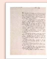
ES.10037.AHP /25.26//ML/1:14 ES.10037.AHP /2.3.1.08//RA/255:101